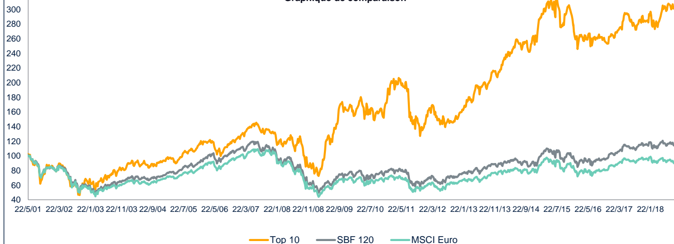
Graphique de comparaison

** date de création mandat Top 10 : juillet 2009