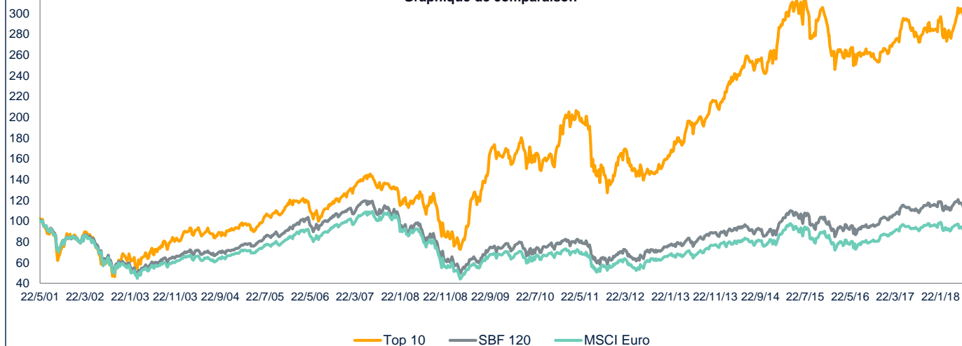
Graphique de comparaison

** date de création mandat Top 10 : juillet 2009