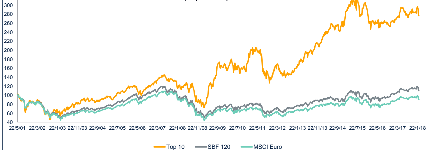
Graphique de comparaison

** date de création mandat Top 10 : juillet 2009